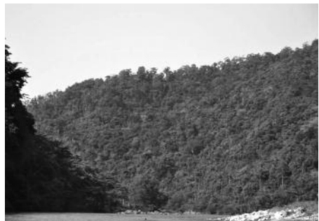
Il·lustració 1: Bosc madur a l'Edén

Protecció del bosc: el 75% d'una àrea de 600 Ha de l'Edén és bosc verge protegit. Aquest