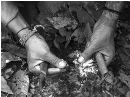
Il·lustració 3. Organismes de muntanya de sòl sa a l'Edén