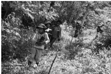
Il·lustració 4. Reforestació amb infants i adults a l'Edén