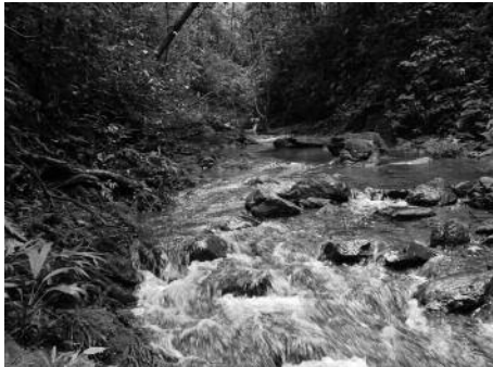
Il·lustració 2. Una de les 17 fonts d'aigua protegides a l'Edén

Reforestació: La reforestació és una de les activitats de més importància, tant per la conservació de l'aigua com per al sòl fèrtil. Els últims anys hem reforestat els prats que en principi eren utilitzats només per a ramaderia i per a cultius implementant el sistema silvopastoril, que integra harmoniosament ramats, cultius i natura. D'altra banda, s'ha fet reforestació a les