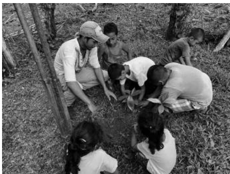
Il·lustració 6. Nens plantant arbres a la escola