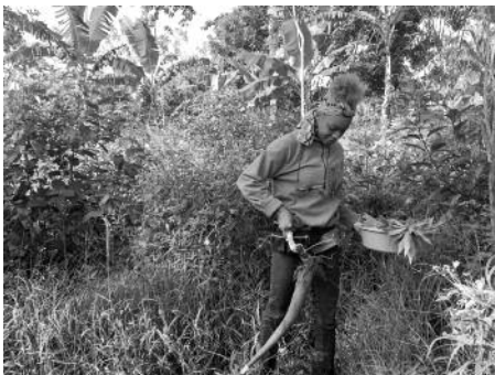
Il·lustració 5. Cultiu de iuca a l'Edén

La tercera ètica és el respecte i la cura de les persones. Fomentar relacions humanes en convivència responsable, equitativa i respectuosa, ja que tots els nostres comportaments afecten tot el que ens envolta.