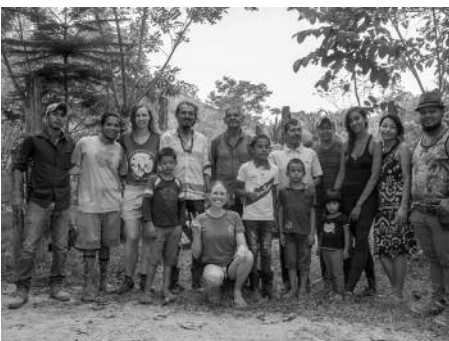
Il·lustració 7: Equip de treball a l'Edén, voluntaris i responsables del projecte